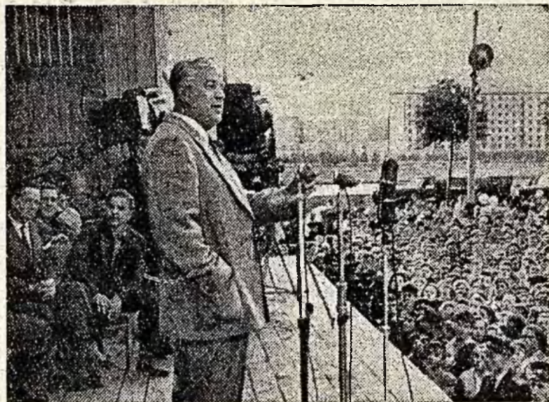
В Центральном парке культуры и отдыха имени Горького состоялся праздник «Московского дня кино». На снимке: народный артист СССР М. Жаров выступает перед посетителями парка.